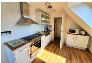
Die helle Küchenzeile ist gut ausgestattet. Hier lassen sich leckere Mahlzeiten zubereiten.