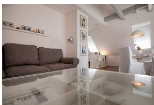
Die gemütliche Couch