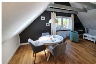
Ihr heller und lichtdurchfluteter Essbereich...