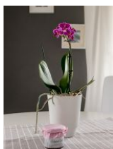
... liebevoll dekoriert.