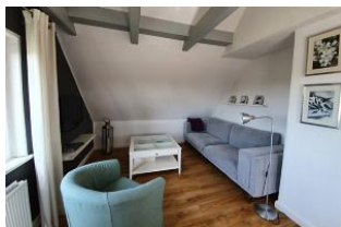
Das großzügige und modern eingerichtete Wohnzimmer für gemeinsame Urlaubsstunden.

Herzlich willkommen im "Haus zur See". Mit ihrer hellen und modernen Einrichtung, sowie auch der schönen Aussicht aus dem 2. OG bietet die Dachgeschosswohnung den geeigneten Platz um Ihre Urlaubstage zu genießen. Der beliebte Südstrand ist weniger als 300 m entfernt. In der gleichen Entfernung finden Sie auch einen kleinen Supermarkt, einen Bäcker und zahlreiche Restaurants. Sollten sie trotz der kurzen Wege nicht auf Ihren PKW verzichten wollen können Sie gerne die hauseigene Stellplätze nutzen.