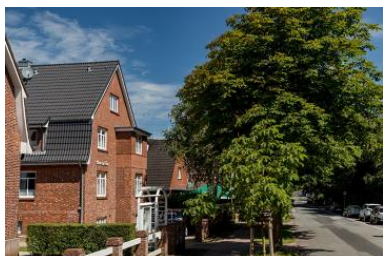
Die Unterkunft befindet sich im 2. OG (Hochparterre).