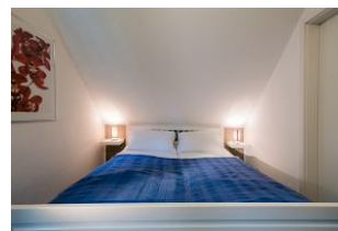
Das gemütliche Schlafzimmer mit Doppelbett.