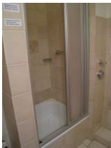
.. Dusche mit tiefer Wanne.