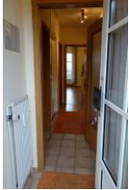
Der Eingangsflur....treten Sie ein..