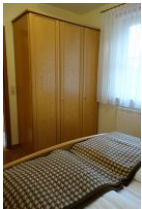
Ein großer Schrank für Ihre Kofferinhalte.