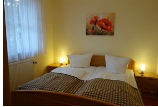
Schlafzimmer mit großem Doppelbett