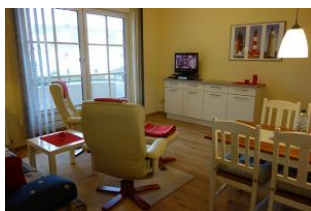
Zwei Relaxstuhl zum Fernsehen, entspannen, lesen ....