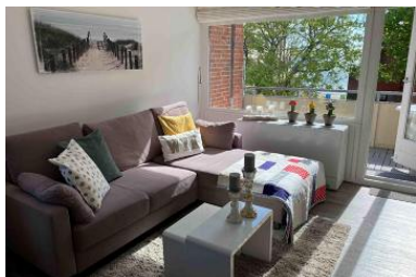
Die Unterkunft befindet sich im 3.OG.

Die Wohnung Luett Lee im Huus in Lee am Sandwall 60 liegt nur 50 m vom Hauptstrand entfernt in zweiter Reihe und sehr zentral gelegen, am ruhigen Ende des lebhaften Ortszentrums und der Flaniermeile Sandwall. Vom Fähranleger sind es nur 750 m (10 Minuten zu Fuß oder ganz bequem per Taxi, mit Gepäckservice auf Anfrage). Die 43 m 2 große, lichtdurchflutete Wohnung Luett Lee liegt im 3. OG des Hauses (Endetage) und lädt Sie/Euch auf dem großen Ost-Balkon zum sonnigen Frühstück ein. Der großzügige Wohnbereich mit einem kuscheligen Lounge-Sofa, der bequeme Essbereich und die komplett ausgestattete Küchenzeile mit Nespresso Kaffeemaschine ermöglichen Wohlbehinden zu allen Jahreszeiten. Das separate Schlafzimmer mit Doppelbett verfügt über einen (kleinen) begehbaren Kleiderschrank. In dem modernen Duschbad sorgt ein großes Fenster für viel Tageslicht und die elektrische Handtuchheizung bei Bedarf für wohlige Wärme. Smart-TV (32, Full HD, Netflix, Amazon Prime), eine HiFi-Music-Station (Streaming, DAB+, UKW, CD, USB) und ein sehr schnelles WLAN (100 MBit/s) bieten allerbestes Entertainment mit der Option auf entspanntes mobiles Arbeiten im Urlaub. Weitere Ausstattungsmerkmale: