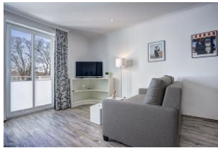
TV und Couch