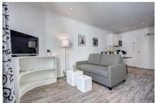
TV und Couch