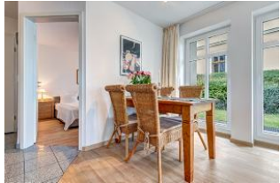
Essplatz und Blick in Schlafzimmer 1