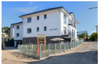
Essplatz und Küchenzeile