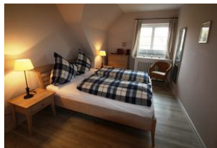
Das freundliche Schlafzimmer.