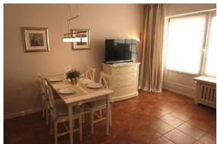
Die hübsche Essecke lädt zu gemeinsamen Essen ein.