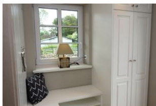
Treten Sie ein, ein kleiner Flur mit Sitzbank erwartet Sie...