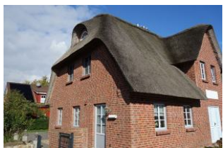
Der linke Eingang führt in das Haus 2

Im idyllischen Dorf Oevenum finden Sie das Doppelhaus "Golfoase" Zwei großzügige Doppelhaushälften für jeweils 6 Personen erwarten Sie. Ein gemütliches Wohnzimmer mit offener Küche und familientauglichem Essplatz. Austritt in den Garten und zur möblierten Terrasse. Ein großes Duschbad mit Waschmaschine und Trockner. Im Obergeschoß die Schlafräume und ein weiteres Bad mit Dusche und Badewanne. Hier ist an alles gedacht, hier kann man sich wohlfühlen, hier wird es Ihnen einfach nur gut gehen, und das Beste....hier darf auch Ihr Vierbeiner dabei sein.