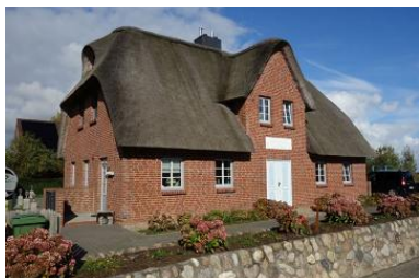
Das Doppelhaus "Golfoase"

Die Unterkunft verteilt sich über EG, 1.OG und DG.