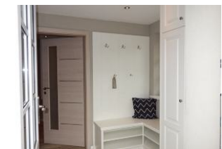
...selbstverständlich mit Garderobe, unter der Bank finden Schuhe ihren Platz.