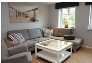
Die große Couch hat für alle ein Plätzchen