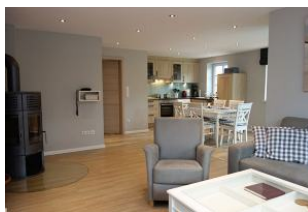
Der gemütliche Sitzbereich mit Blick zum Esstisch und zur Küche.