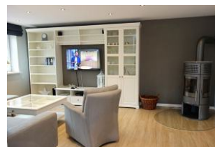
Herrlich ....ein Ofen. Holz gibts im REWE-Markt