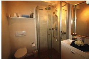
Ihr Bad mit Dusche