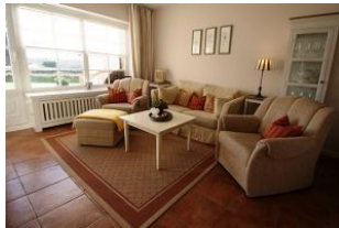
Der gemütliche Wohnbereich zum Entspannen und Wohlfühlen.