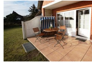
Die große Terrasse mit eigenem Strandkorb. Hier hören Sie bereits beim Frühstück die Wellen rauschen.