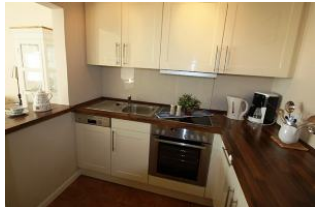
Die schöne Küche mit der offenen Durchreiche, lädt zum Kochen ein

In unmittelbarer Strandnähe, windgeschützt im idyllischen Bredland gelegen, verbringen Sie Ihren Urlaub ganz im Sinne "Föhr leben". Bei dieser liebevoll eingerichteten Wohnung, den herrlichen Strand in unmittelbarer Nähe, atmen Sie Meeresluft sobald Sie die Tür öffnen. Lichtdurchflutet, hochwertig und liebevoll eingerichtet. Von der eigenen teilüberdachten Südterrasse gelangen Sie direkt auf die weitläufige Liegewiese, die direkt zur Meereseite übergeht. Hier können Sie Ihren Urlaub in aller Ruhe genießen!