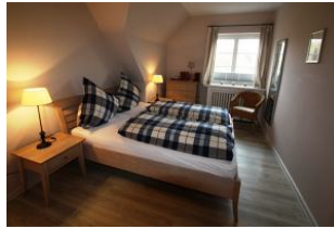
Das freundliche Schlafzimmer.