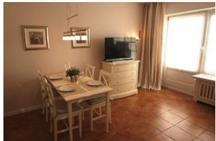
Die hübsche Essecke lädt zu gemeinsamen Essen ein.