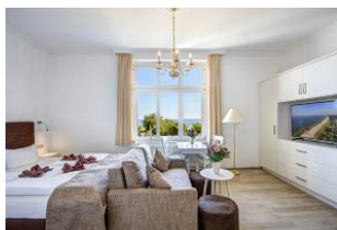
Schlafen, Wohnen, Essen