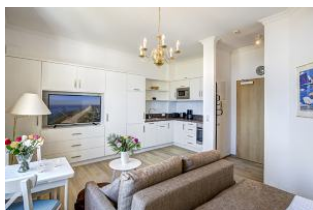
Wohnen, Essen, Küche