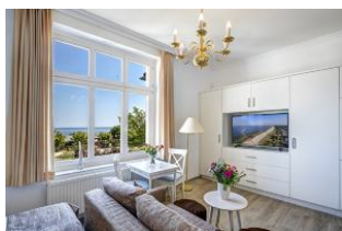
Wohnen, Essen, Seeblick

Direkt an der Strandpromenade mit direktem SEEBLICK! Schönes geräumiges 1 - Zimmer - Apartment im I. OG mit hübscher Möblierung und guter Ausstattung, Küchenzeile, Duschbad und Blick zur See. Die Wohnung verfügt über einen Pkw-Stellplatz. In der Garage können Fahrräder und ähnliches untergestellt werden. Im Haus gibt es eine Sauna. Von der "Villa Germania" aus können Sie das Ortszentrum und die bekannte Ahlbecker Seebrücke in ca. 3 Minuten zu Fuß erreichen. Zum Strand sind es 50 m. Von Mai bis September ist ein Strandkorb im Tagespreis enthalten. Von Mai bis September ist ein Strandkorb im Tagespreis enthalten.