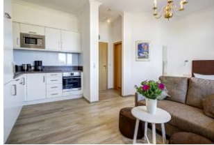
Blick zum Flur und zur Badtür