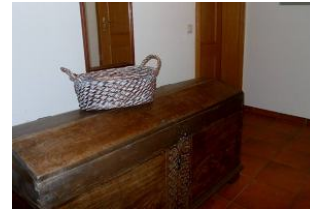
Eingangsbereich in die Wohnung