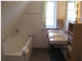
Das Wannenbad im OG.....