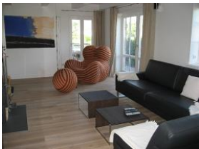
.. die moderne Form des guten, alten Ohrensessels.