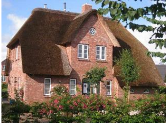
Das Haus Eulenluke in Borgsum

Die Unterkunft verteilt sich über EG und 1.OG.