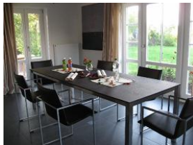
Der Esstisch bietet allen Familienmitgliedern Platz.