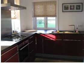
Die moderne Küche mit Ceranfeld und Gaskochstelle.