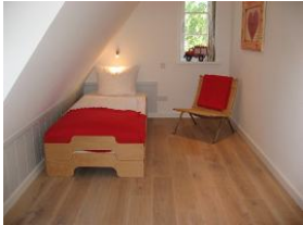
Ein weiteres Schlafzimmer für 2 Personen (Stapelbetten 90x200cm)

Entfernungen, zirka: zum Bäcker 30m, zum Einkaufsladen 2,5km, zum Flugplatz 4,0km, zum Golfplatz 4,0km, zum Hafen 7,5km, zum Meer 1,0km, zum ÖPNV 100m, zum Badestrand 1,0km, zum Ortszentrum 30m