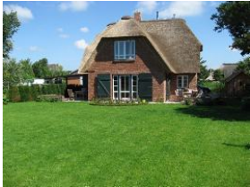
.. die rückwärtige Ansicht mit Garten.

Unser neuestes Haus steht in Borgsum auf einem ca. 1000qm großen Grundstück für Sie bereit. Sehr modern eingerichtet bietet es sieben Personen Platz für einen erholsamen Urlaub. Wer "unter Reet" wohnen, aber trotzdem auf modernes Interieur und technischen Komfort nicht verzichten möchte, ist in der Eulenluke genau richtig aufgehoben. Möchten Sie dieses Haus nur mit 2 Personen bewohnen, gewähren wir auf den Tagesmietpreis 10% Ermässigung.!