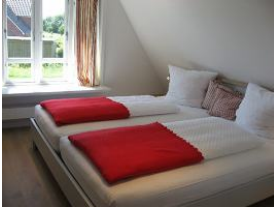
Das Elternschlafzimmer im OG