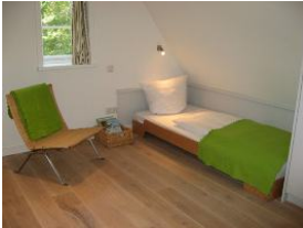
...und noch ein Schlafzimmer für 1 - 2 Personen