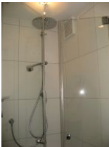
... mit zus. Duschkabine.