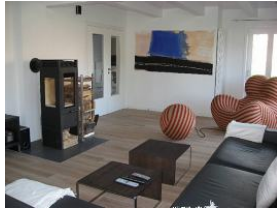
Im Wohnzimmer die große Eckcouch und der Ofen. Nicht im Bild: Fernseh - Radiotechnik. Und ein Sessel.....