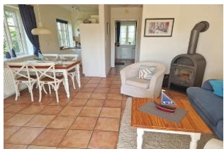
Der Essplatz und die offene, komplett ausgestattete Küche mit Geschirrspüler schließt sich dem Wohnzimmer an.