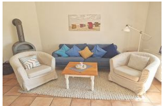
Das Erdgeschoß wurde mit Terrakottafliesen und Fußbodenvorwärmung ausgestattet. Hier befindet sich das behagliche Wohnzimmer mit Kaminofen.

Diese gemütlich eingerichtete rechte Doppelhaushälfte in Nieblum im Babendörpstieg 22 lädt 4 Personen zur Erholung ein. Unsere Gäste sollten Nichtraucher sein. Die strand- und dorfnah Lage bietet einen Urlaub mit kurzen Wegen. Im schönen Ortskern von Nieblum mit seinen historischen Reetdachhäusern finden Sie alle Einkaufsmöglichkeiten, Cafes, Restaurants, Minigolf, Frisör und E-Ladestation für Ihren PKW.