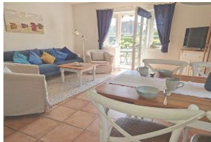
Man hat einen direkten Zugang auf die möblierte Süd-West-Terrasse mit Strandkorb (April- Anfang Okt.)