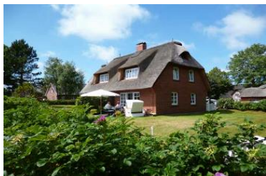
Gemütliches Endreihenhaus unter Reet in Nieblum, Bi de Süd 17.

Die Unterkunft verteilt sich über EG und 1.OG.