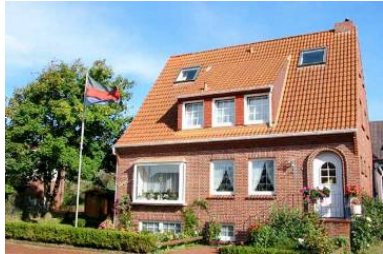
Unser Haus Töwerland liegt in ruhiger, zentraler Lage.