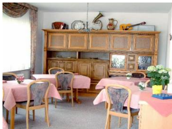
Unser Frühstücksraum und Aufenthaltsraum.

Unser wunderschönes Töwerland (Zauberland).