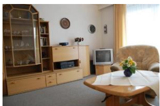
Ihr gemütliches Wohnzimmer

Sie suchen eine gemütliche 2-Raum-Wohnung in zentraler Lage, die Ihnen die nötige Ruhe für Ihre Entspannung bietet? - Das Appartement wurde ganz neu und sehr stilvoll für Sie eingerichtet. Die Wohnung verfügt über SAT-TV, liegt im 2. Stock mit Balkon. Die nächste Einkaufsmöglichkeit befindet sich in unmittelbarer Nähe (Edeka-Markt, Bäcker und Waschsalon). Den Strand und den Kurpark erreichen Sie zu Fuß in ca. 5 Minuten. Auch zum Ortskern mit seinen vielen Einkaufsmöglichkeiten und Gaststätten gelangen Sie bequem in wenigen Minuten. Wir wünschen Ihnen einen angenehmen und erlebnisreichen Urlaub.