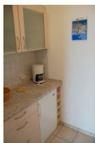
Die neue Küche