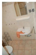
Das moderne, neue Bad