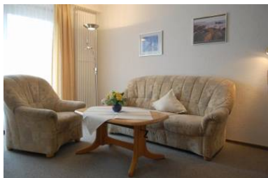
Die gemütliche Sofaecke