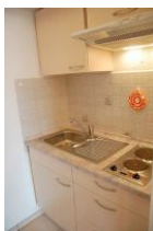
Die gegenüber liegende Seite