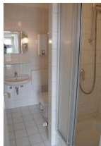
Das geräumige Duschbad