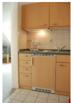
Die neue Küche