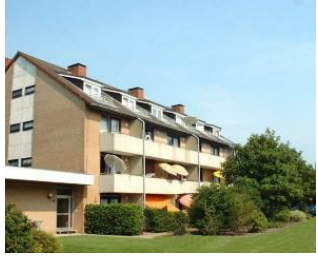
Das "Hus Willem"