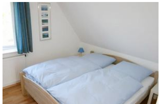
Schlafzimmer OG rechts