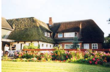
Willkommen im Hotel garni "Zur Post"