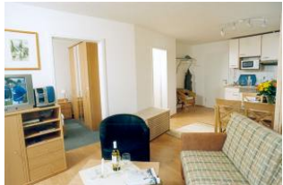
Wohnbereich, Essbereich, Küchenzeile und Blick in das Schlafzimmer

1. Reihe, direkt an der Strandpromenade mit BALKON und FAHRSTUHL im Haus! Schönes geräumiges 2-Zimmer-Apartment mit moderner guter Ausstattung und ausschnittweisem Seeblick. Separates Schlafzimmer, Wohnzimmer mit Küchenzeile und Essplatz, Bad mit Wanne mit Duschtür, Balkon nach Osten - zum Frühstück in der Sonne. Die Wohnung verfügt über einen Tiefgaragen-Pkw-Stellplatz. In der Garage können auch Fahrräder und ähnliches untergestellt werden. In unserer "Villa Germania" nebenan gibt es einen Wellnessbereich mit Sauna und Solarium. Von der "Villa Aquamarina" sind es zum Ortszentrum und der Seebrücke ca. 3 Minuten zu Fuß. Zum Strand sind es 50 m.