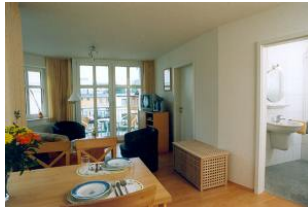
Essplatz, Wohnbereich und Blick in das Duschbad