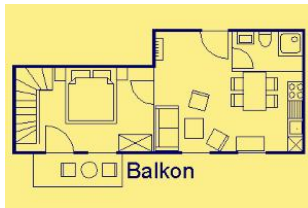
Wohnungsgrundriß untere Ebene