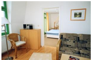
Wohnbereich, Blick in das Schlafzimmer mit Empore

STRANDNAH mit SÜDBALKON! Nur ca. 100 m zur Strandpromenade! Schönes gemütliches Maisonette-Apartment mit 2 Zimmern und zus. Schlafräum auf der Empore, gute Ausstattung. Separates Schlafzimmer, zus. Maisonette-Schlafraum, Wohnzimmer mit Küchenzeile und Essplatz, Duschbad, Südbalkon. Die Wohnung verfügt über einen Pkw-Stellplatz. Abstellraum für Fahrräder und ähnliches ist vorhanden. Der Wellnessbereich mit Sauna und Solarium in der "Villa Germania" kann ebenfalls genutzt werden. Vom Haus aus können Sie das Ortszentrum und die bekannte Ahlbecker Seebrücke in ca. 3 bzw. 5 Minuten zu Fuß erreichen.