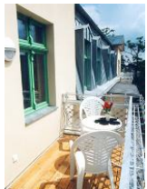
Großer Süd - Balkon