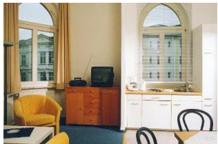
Wohnbereich und Küchenzeile

STRANDNAH! Nur ca. 70 m von der Strandpromenade liegt dieses helle und südausgerichtete 2-Zimmer-Apartment mit freundlicher Ausstattung. Separates Schlafzimmer, Wohnraum mit Küchenzeile und Essplatz, Duschbad. Die Wohnung verfügt über einen Pkw-Stellplatz in der Nähe des Hauses. Fahrradabstellraum ist vorhanden. Im Haus gibt es eine Sauna. Der Wellnessbereich mit Sauna und Solarium in der "Villa Germania" kann ebenfalls genutzt werden. Vom Haus aus können Sie das Ortszentrum und die bekannte Ahlbecker Seebrücke in ca. 2 Minuten zu Fuß erreichen.