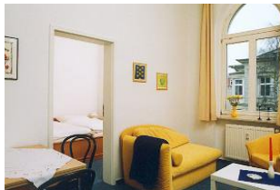
Blick von der Küchenzeile in den Schlafraum. Links neben dem Eßplatz befindet sich die Tür zum Duschbad.