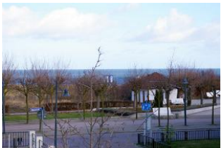
Seeblick aus der Veranda von Wohnung Nr. 6