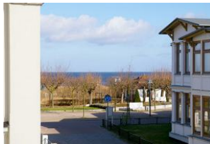
Seeblick aus der Veranda von Wohnung Nr. 4