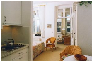
Blick in die sehr gemütliche Wohnung mit schönem Seeblick aus der Veranda

STRANDNAH mit SEEBLICK, nur ca. 40 m zur Strandpromenade! Hübsches 2-Zimmer-Apartment mit gemütlicher Einrichtung. Kombiraum mit Doppelbett, Küchenzeile mit Essplatz, Duschbad und Veranda als Wohnraum mit ausschnittweisem Seeblick. Ein Fahrradabstellraum ist vorhanden. Die Wohnungen verfügen jeweils über einen Pkw-Stellplatz. Der Wellnessbereich mit Sauna und Solarium in der "Villa Germania" kann genutzt werden. Vom Haus aus können Sie das Ortszentrum und die bekannte Ahlbecker Seebrücke in ca. 5 Minuten zu Fuß erreichen.