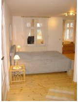
Links die Tür zum separaten Schlafzimmer