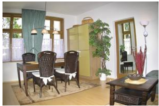
Blick in den Wohnraum.

Geräumige, helle Wohnung in zentraler, ruhiger Lage mit großer Terrasse in Südwest Lage. Geschmack- und liebevoll eingerichtet mit 1 Wohnraum, 2 Schlafräumen, Bad und Veranda. Komplett ausgestattete Küche.