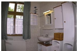
Blick in das Bad.