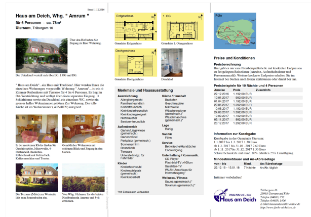
Abbildung 3: Beispiel eines automatischen PDF-Unterkuftsprospektes (siehe 7.6). Diese farbigen Prospekte können Sie auch für den Eigengebrauch nutzen. Das 3-Spalten-Layout ist ggf. auf eine DIN-A4-Seite (Querformat) beschränkt und der Prospekt lässt sich zu einem DIN-C6-lang-gerechten Faltblatt falzen.

Änderungen in der Gestaltung sind gegen Aufwand möglich.